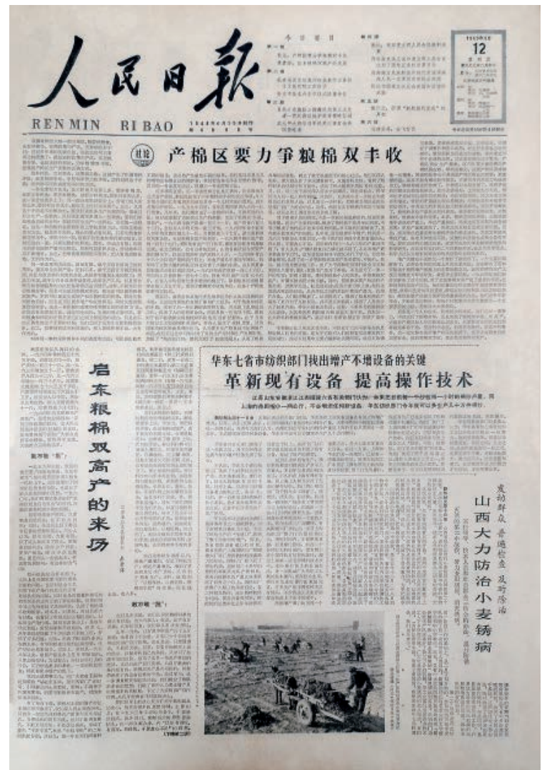
1965年3月12日《人民日报》刊载《启东粮棉双高产的来历》

时期的工业发展，大致可分为4个途径：一是采用“老带新”“大带小”“子带孙”的办法，老厂出人、出钱、出设备发展了一批新工厂。大生一厂带出了纺机厂、纺器厂、缫丝厂、毛毯厂和大生化工厂等；大生副厂带出了轴承厂、内衣针织厂、农业