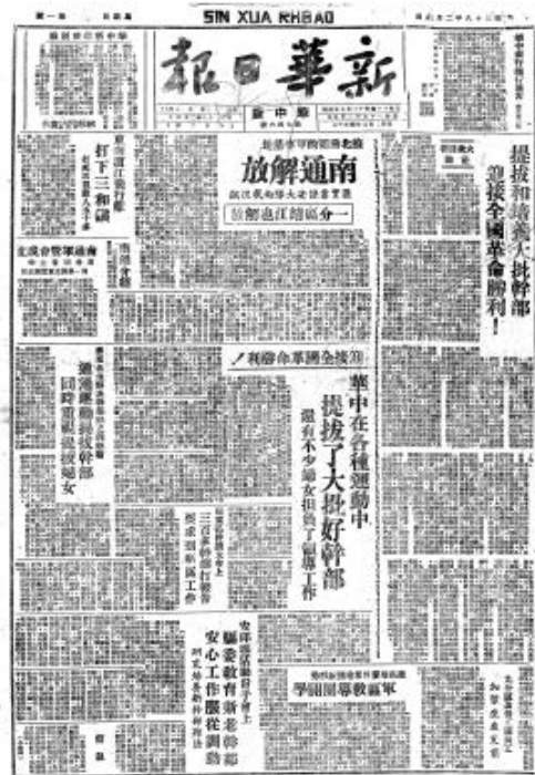
1949年2月6日《新华日报》华中版报道《南通解放》

贯彻农业为基础方针,在加强农田水利建设的基础上大力发展农业。20世纪50年代后期,加强河道整治,特别是1958年至1960年,按照一二三四级河道全面配套的要求,首先集中主要力量抓好主干河道的建设,并