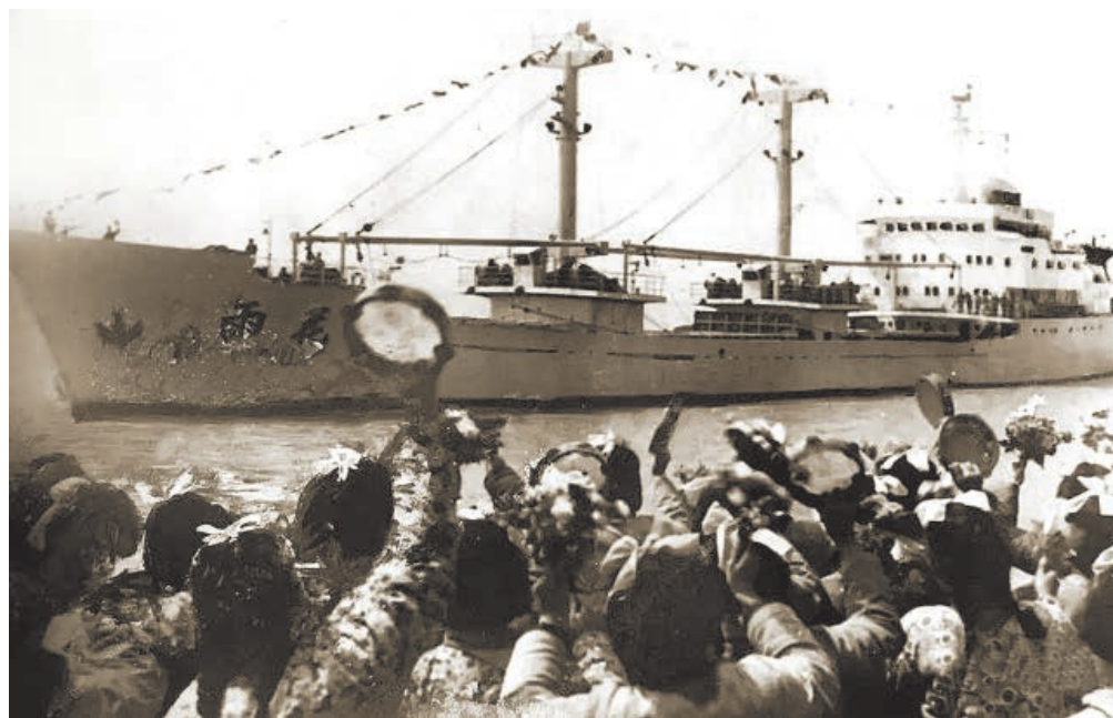
1980年3月“雨花”轮首次从南通运送棉花去香港，南通港正式开办外贸运输。

以人为本的社会保障制度改革全面推进。1985年，在全省率先由劳动部门办理社会养老保险，规定劳动合同制工人实行社会劳动保险。从1993年起，市区全面启动一体化养老保险制度，参加养老保险的企业职工不分企业所有制性质、用工形式，一律按工资总额的比例缴纳养老保险费，退休后按同等条件享受同等待遇。