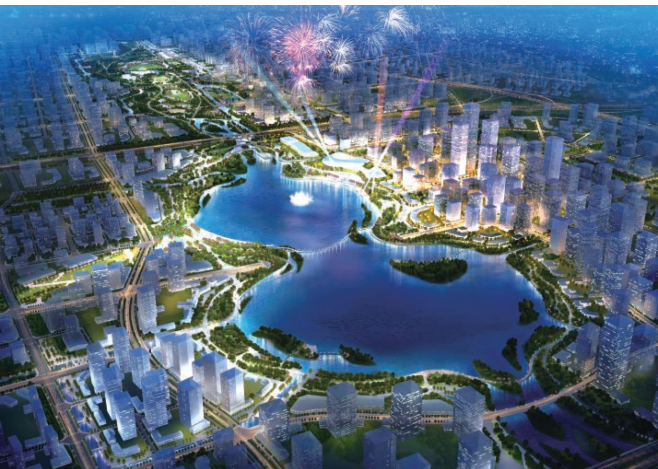
中央创新区效果图

1988 年实现地区生产总值超过 100 亿元。2003 年，实现地区生产总值超千亿、财政收入超百亿的跨越。此后，地区生产总值不断跃上新台阶，2007 年超过 2000 亿元，2010 年超过 3000 亿元，2011 年超过 4000 亿元，2013 年超过 5000 亿元，2015 年超过 6000 亿元，2017 年超过 7000 亿元。2018 年，全市地区生产总值超过 8400 亿元，与有统计的 1978 年相比，增加了 280 多倍，多项综合发展指标位居全省乃至全国地级市前列。