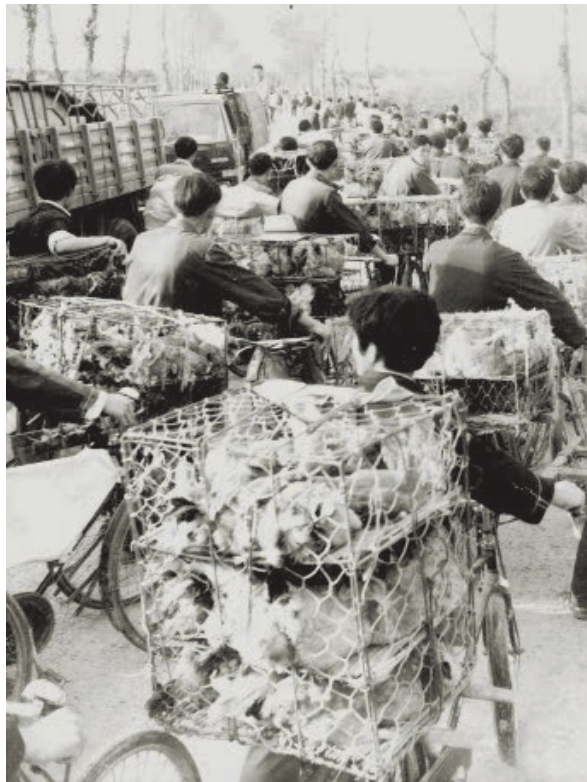
1984年，百万雄鸡下江南。

整、改革、整顿、提高”八字方针，组织工业经济产业结构和产品结构调整，提高经济效益。1981年8月18日，新华社报道，南通市成为全国工业城市生产发展速度快、经济效益好、被誉为“明星”的中等城市之一。之后，《人民日报》在头版头条刊登了新华社的消息：南通市工业经济效益跃居全国前列，成为继常州市之后又一个人均工业产值超万元的中等城市。此后，南通工业经济快速发展，包括电视机、收录机、电风扇、自行车等在内的明星产品进入社会居民生活。南通电视机厂生产的三元电视曾经叫响全国，是南通工业，尤其是电子仪表工业代表性的品牌。1987年10月，三元14英寸彩色电视机和17英寸黑白电视机分别在全国首届彩电质量评比和全国第五届黑白电视机质量评比中获一等奖。“三元三元，连中三元”的广告语广为流传。