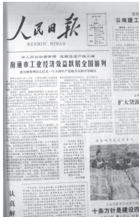
1981年，南通成为“明星城市”。

南通的发展得到中央主要领导关注。9月，国家经委领导考察调研南通后，认为南通经济很有特色，形成《南通工业发展迅速，人均产值万元以上，国民收入千美元以上》的调查报告。11月16日，中共中央总书记胡耀邦在报告上批示：“要加以报道，要鼓舞全国有一个实实在在的你追我赶的劲头。”