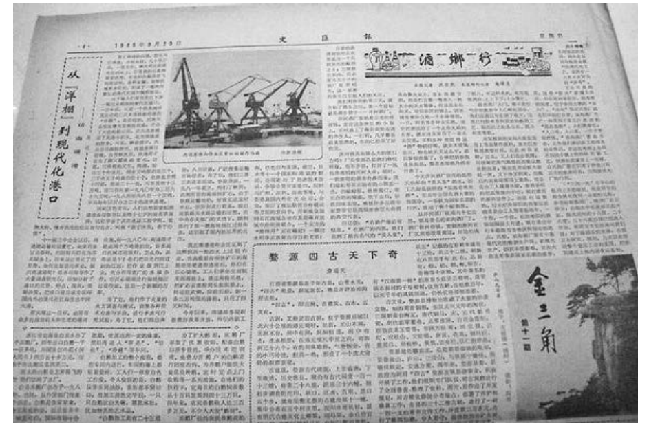
1985年9月29日《文汇报》刊载《从“洋棚”到现代化港口——访南通港》

靠江靠海的南通，将独特的港口优势转化为现实的优势，在开发外贸运输的同时，注重开拓中转运输，港口吞吐量迅速增加，1985年12月27日突破1000万吨，一举跨入全国大港口行列，奠定了在全国港口运输中的地位。此后，南通港在自身发展的同时，也使南通经济不同程度打上了港口经济的印迹。