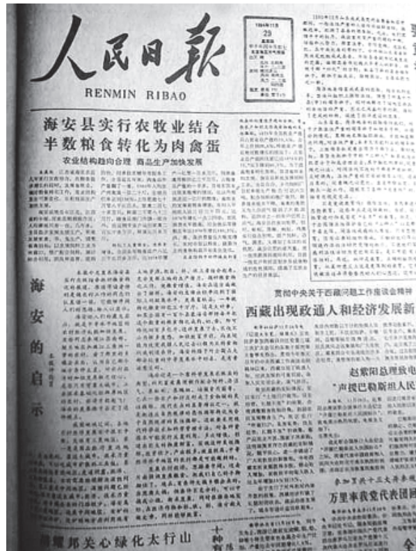
《人民日报》评论员文章《海安的启示》

80年代初，海安县在农副业发展中走出了一条“种养加出，综合经营”为主要模式的“海安之路”。1984年11月29日，《人民日报》在头版头条以《海安县实行农牧业结合，半数粮食转化为肉禽蛋》为题，报道了海安近年实行农牧结合，农业结构发生变化，农村商品生产发展的消息。同时配发题为《海安的启示》的评论员文章，认为“海安的路子对全国占大部分比重的中等发展水平的县，是 有着普遍意义的”。此前的1983年12月，新华社记者在《中国农民报》头版头条以《百万雄鸡下江南》为题，报道了海安成千上万的农民骑自行车驮鸡运往南京、上海等大城市销售的壮观场面。