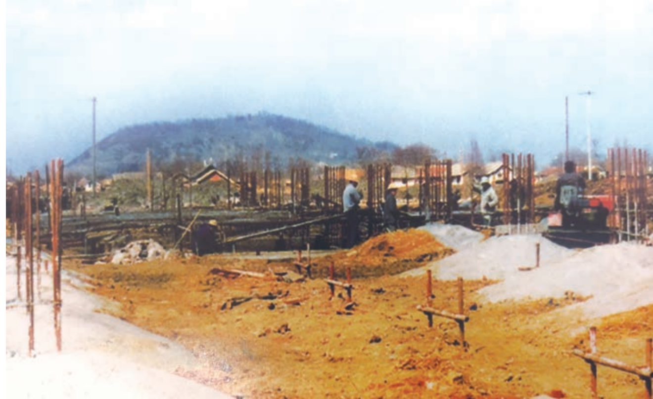
开发区第一幢标准厂房建设工地

20 世纪 80 年代初，一些地区开始建立股份制企业。1985 年，南通市试行股份制。是年，海门县汤家乡中心村实行群众差额股份制。早在 1982 年，汤家公社长虹工业公司即组建了股份合作性质的企业。1987 年，南通市信托投资公司成立，由通棉一厂、通棉二厂、碳素厂、五交化公司等 13 家企业、单位联合投股，拥有资金 2000 万元。是年，市区大型商业综合服务企业——市虹桥股份有限公司成立。经过几年探索，进入 90 年代，股份制逐步成为企业改革和运行重要的所有制形式。