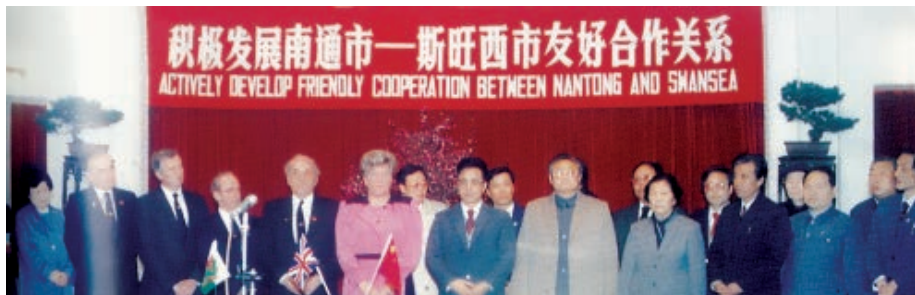
南通与英国斯旺西市缔结友好城市

广泛开展对外友好往来，既是进一步对外开放的组成部分，同时又可以在世界各地广纳朋友，为南通的对外开放营造宽松的国际环境。随着进一步对外开放，南通与国际间的友好往来频繁进行。1985 年，南通市开始尝试与英国斯旺西市建立友城关系。1986 年外交部批复同意南通市与斯旺西市缔结为友好城市，双方于 1987 年 4 月正式缔结友城关系。至 2018 年底，南通陆续与 15 个国家（地区）的 24 个城市缔结友城关系。