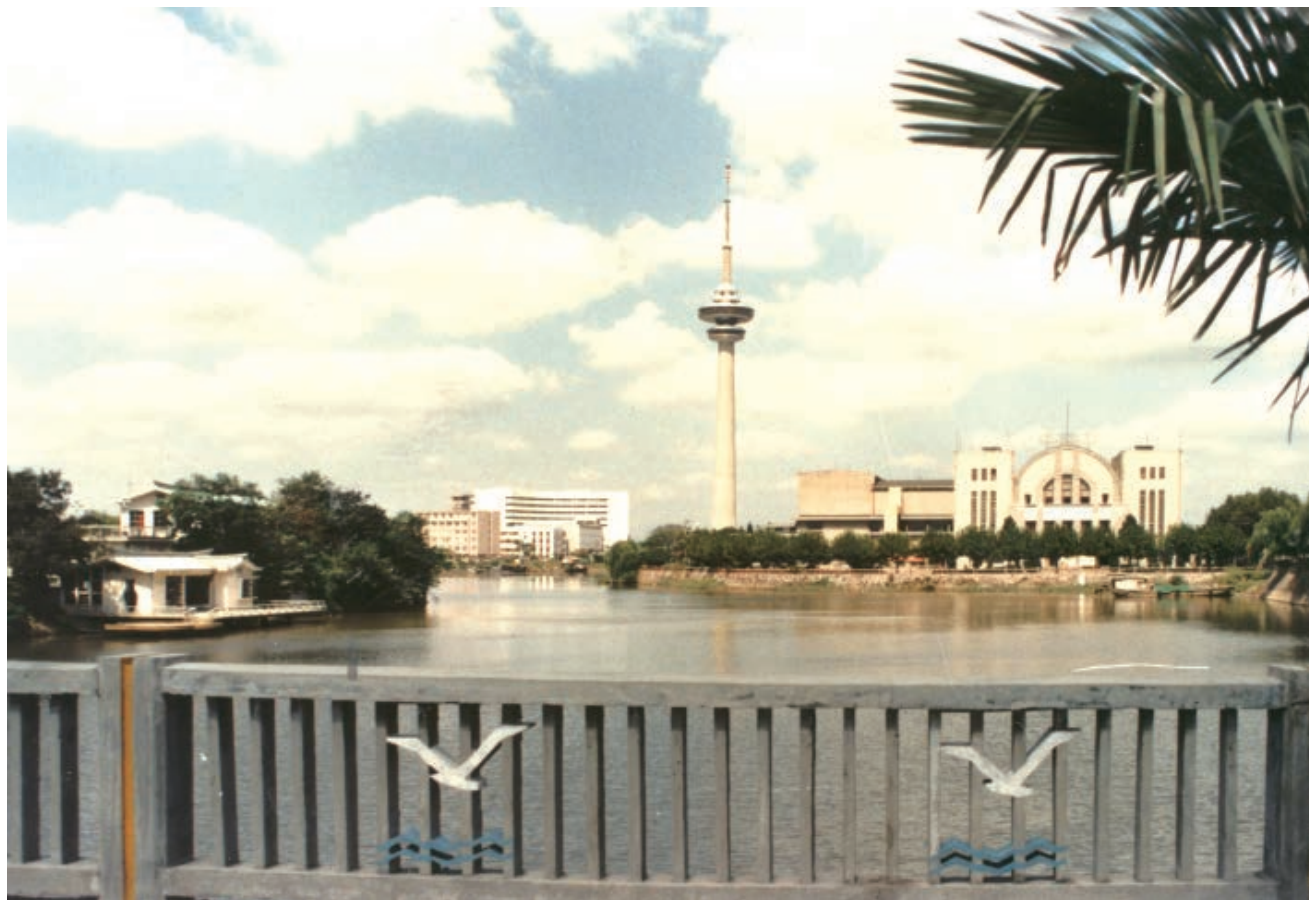
1990 年，南通电视塔。

1986 年，南通市开始在大中型国营工业企业中逐步推行各种形式的承包经营责任制，中小型工业企业和商业零售企业实行租赁经营或全民改集体经营。1987 年，承包制成为企业改革的主要形式，全市 200 多家小型工业企业采取招标、投标等竞争形式，或通过专家论证方式，实行国家所有、集体承包和租赁给个人经营。经过两年时间，到 1988 年底，全市预算内工业企业的承包面超过 90%，其中全民工业企业全部实行承包经营。在企业经营层面，计划体制和平均主义逐步被打破。