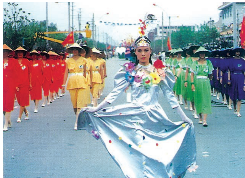
南通首届民间艺术节

1987年9月19—24日，中国南通首届民间艺术节举行。艺术节期间，中外宾客1800多人云集南通，南通市以民间歌舞、民间工艺美术精品、通派盆景、民间服饰等形式展示民间艺术。活动期间签约150多个项目，引进资金3000多万元，实现“文化搭台，经济唱戏”。后于1990年9月和1992年9月分别举办南通市第二届、第三届民间艺术节。