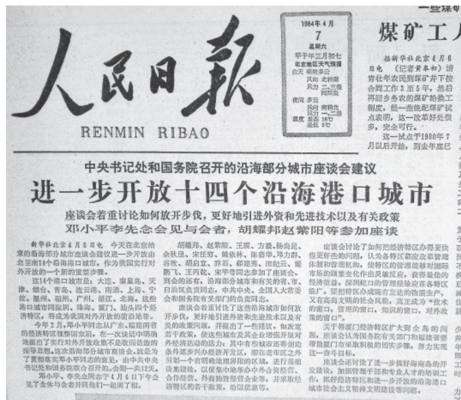
南通成为全国首批进一步对外开放港口城市

党的十一届三中全会确定了对外实行开放、对内搞活经济的方针。根据实际情况，需要在对外开放方面迈出新的步伐。1984