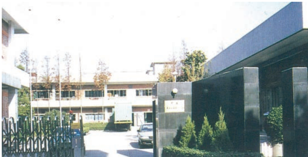
南通第一家合资企业——中国南通力王有限公司

1982年2月12日，南通第一家中日合资经营企业——中国南通力王有限公司动工兴建，同年11月23日举行开业典礼。这也是江苏省第一个建成投产的中外合资企业。企业于1983年投产，当年即盈利。在此带动下，1984年，南通新批准建立4家中外合资企业。1985年，全省新批准的中外合资企业中，南通占四分之一以上。南通引进外资工作一度走在全省前列。