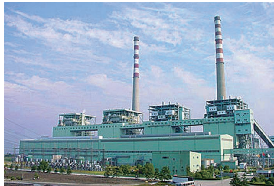
华能南通电厂二期工程竣工后全貌

伴随近代产业的出现，南通的电力工业也随之发展起来，但基础一直较弱。20世纪80年代，随着经济的发展，电力供应“瓶颈”越发明显，1985年主要发电企业年发电量只有25万千瓦时，远远不能满足生产生活用电需求。1985年，国务院批准建设华能南通电厂。1986年9月，华能南通电厂一期两台35万千瓦发电机组开工建设。随着华能南通电厂一期于1990年正式投产，以及其后二期工程兴建和天生港电厂改扩建，南通供电形势得到根本改观。