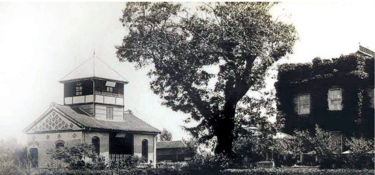
20世纪初的南通博物苑

1988年1月13日，南通博物苑被列为全国重点文物保护单位。南通博物苑由中国早期现代化的先驱、晚清状元张謇于1905年创办。建苑初期，博物苑藏品分天产、历史、美术、教育四部，主要陈列于南馆、北馆等展馆内，而大型文物标本则展示于室外。南通博物苑是中国人独立创办的第一座公共博物馆，也是南通市首批全国重点文物保护单位。