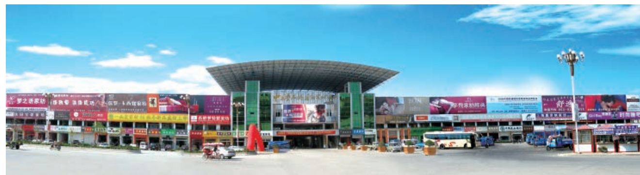
海门叠石桥国际家纺城

20 世纪 70 年代末，在海门三星镇开始形成纺织品集市，最初只有少数个体摊铺。1987 年，“南通市三星叠石桥绣品市场”挂牌，经营规模、品种、商铺不断增加。自此以后，市场经历了从绣品市场、绣品城到国际家纺城的嬗变，最终成为世界最大的家纺市场，成为改革开放以来南通经济发展的缩影。