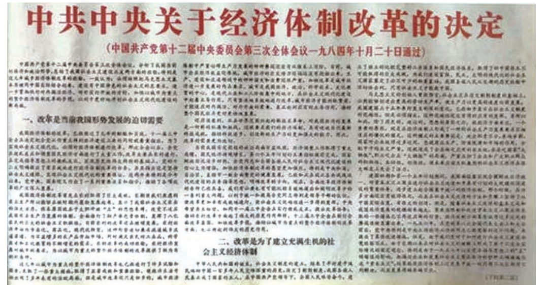
1984年10月21日《人民日报》刊登《中共中央关于经济体制改革的决定》

1984年10月，中共中央制定发布《关于经济体制改革的决定》，以城市为重点推进经济体制改革。年初，南通已经在电机厂、醋酸厂、合成纤维厂、无线电厂、电容器厂、钢丝绳厂、电焊机厂、树脂厂、友谊服装厂等10家市属企业进行改革试点，实行厂长（经理）负责制。10月在市、县33家工业企业中扩大试点。同时，在部分企业中探索实施工资总额与经济效益挂钩及投入产出包干等形式的承包经营责任制。小型商业企业实行租赁经营，将市区饮食服务行业的46家集体零售店租赁给集体或个人经营。随着企业改革的展开，南通的经济体制改革逐步由农村转向城市。