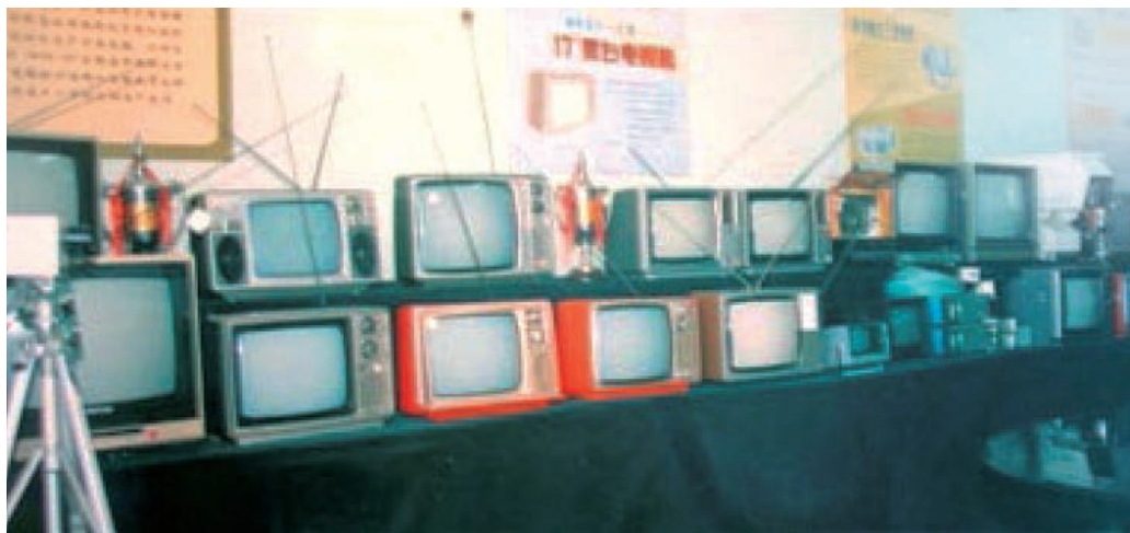
三元牌电视机三次参加全国质量评比，连中国家金银奖。

1986年10月，三元14英寸彩色电视机和17英寸黑白电视机分别在全国首届彩电质量评比和全国第五届黑白电视机质量评比中获一等奖。20世纪80年代后期至90年代初，南通电视机厂生产的三元电视机曾经叫响全国，是南通工业，尤其是电子仪表工业代表性的品牌，“三元三元，连中三元”的广告语广为流传。可惜，随着竞争的加剧，三元电视逐步走向没落乃至消亡，但在短缺经济时代，南通产三元牌电视机以及桃花电扇、长江自行车、宝石花收音机等轻工电子产品进入普通百姓家庭，成为南通工业快速发展的缩影，至今仍然是南通人美好的记忆。