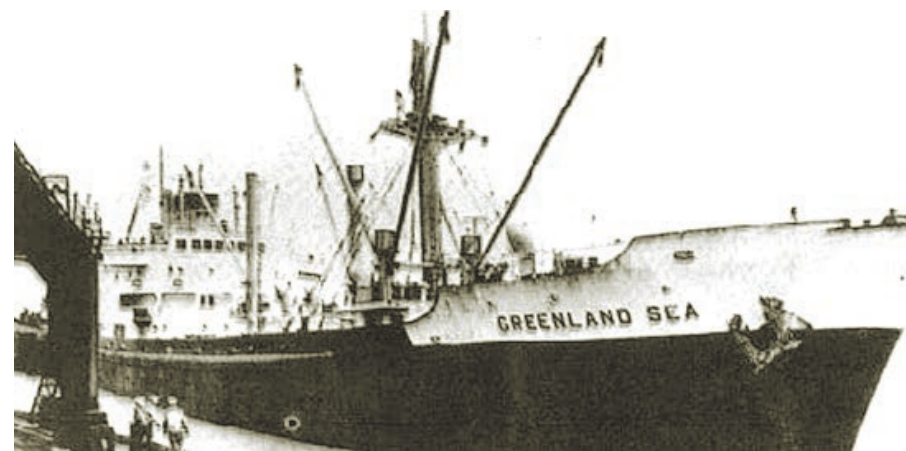
1983年5月，第一艘外轮巴拿马籍“格陵兰海号”驶抵南通港，叩开了南通港通向世界的大门。

早在1976年，南通港即开始试办外贸运输任务，从南通港装载的货物成功运抵香港；第二年，从南通装载的货物成功运往新加坡。此后，一艘艘远洋轮在南通港进进出出，不断考验着南通港的外贸转运能力。1980年3月，国务院批准南通港成为长江对外贸易港；1982年11月，第五届全国人大常委会第25次会议决定，批准南通港对外籍船舶开放。国务院、中央军委批准南通港为国家一类开放口岸。1983年5月，第一艘外轮“格陵兰海号”抵达南通港，南通港在对外开放中日益发挥重要作用。