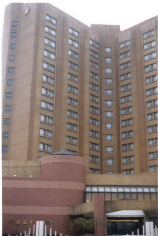
1988年5月，南通大饭店外景。

此前，南通只有少数几家涉外饭店，但标准不高，设施陈旧。随着南通对外开放步伐加快，涉外服务要求提高。在此背景下，1986年，南通市第一家合资饭店——南通大饭店开工建设。这家投资1500多万美元、主体17层的饭店，在建成后，一度成为南通标志性建筑，也是苏北首家三星级、四星级酒店，提升了南通对外服务的水平。