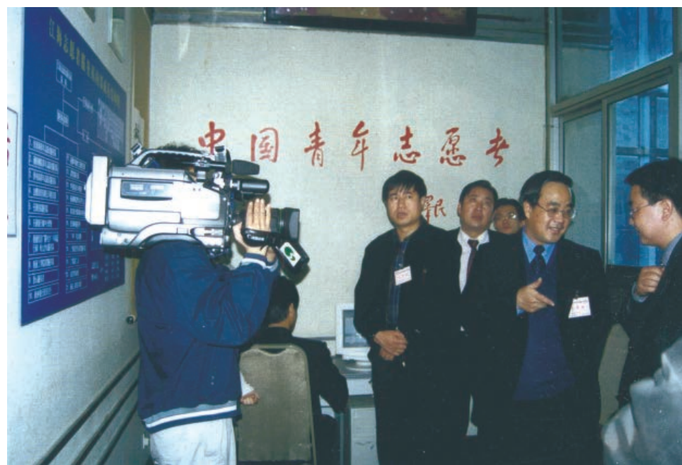
2000年11月4日，团中央领导实地考察江海志愿者服务站。

江海志愿者服务站由共青团南通市委、江海晚报社、南通樱华化妆品有限公司于1998年3月共同创建成立，是多个系统合作、对志愿者与服务对象实行双向招募的志愿者组织，在全省尚属首例。服务站成立以后，大力弘扬雷锋、“莫文隋”精神，广泛开展志愿者服务活动，被人民群众誉为不走的“活雷锋”、看得见