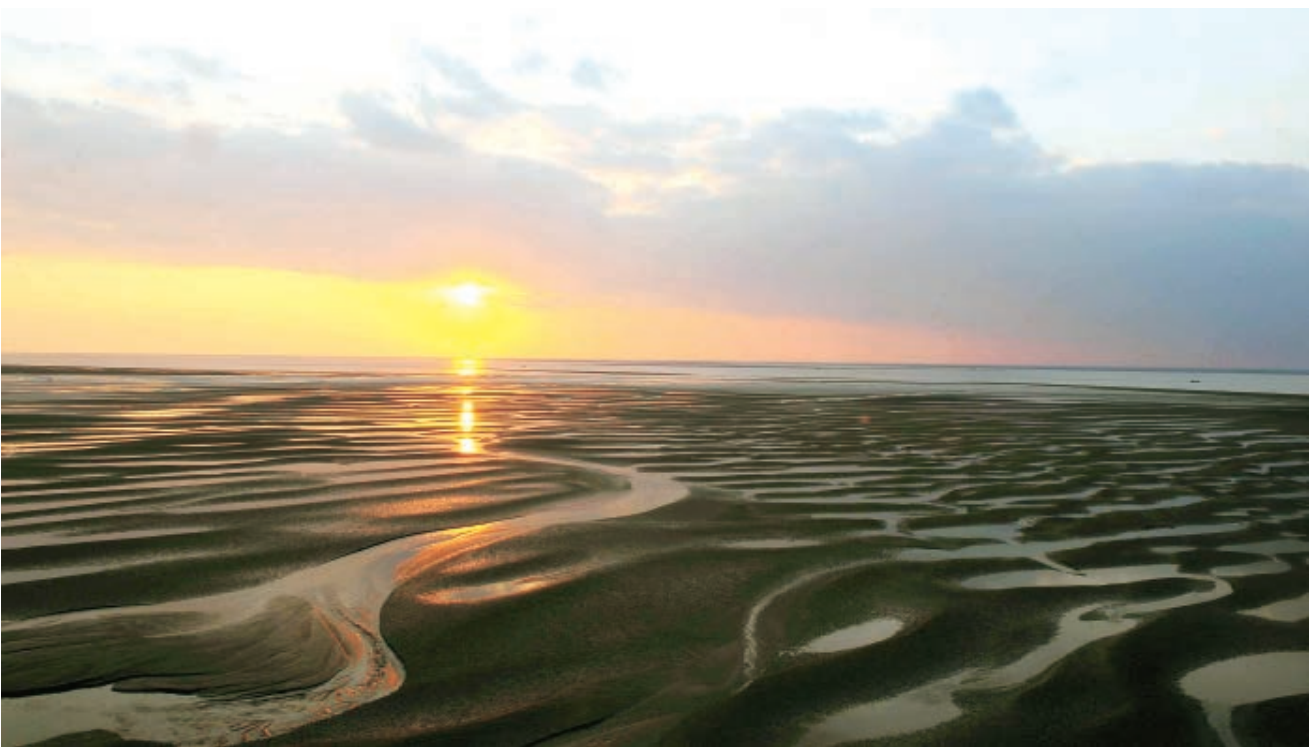
如东沿海滩涂

农业综合开发区（如东）及相继成立的海安外向型农业综合开发区等外向型农业开发区，作为农业对外开放的“窗口”、招商引资的重要基地、农业资源开发的“前沿阵地”和“三高一化”（高产量、高效率、高收益，机械化）农业的示范区，逐步发挥功能。该区后并入洋口港经济开发区。