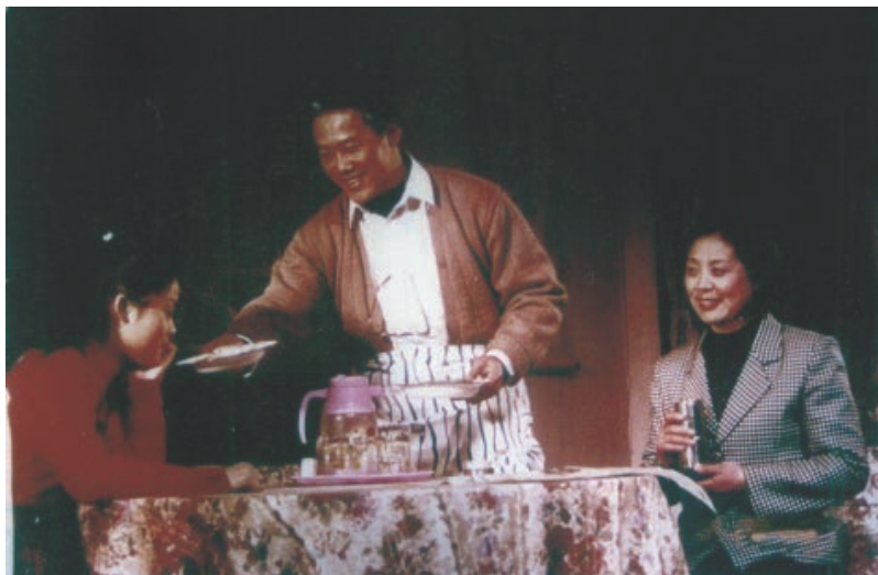
获省“五个一工程”奖的话剧《走近“莫文隋”》剧照

江海儿女在展现“扶贫济困、乐善好施”崇高精神风貌的同时，不断提高自身素质，振奋精神，努力创作优秀作品。1998年，在全省第三届精神文明建设“五个一工程”电影、电视剧（片）、戏剧、广播、歌曲、图书、文章7个评比项目中，南通市送评21件作品，11件作品获奖，7个评比项目均有优秀作品入选，为全省总分第二。其中电影《愁眉笑脸》、电视剧《黑色雨》、话剧《走近“莫文隋”》、歌曲《好收成》等作品在全国产生广泛影响。