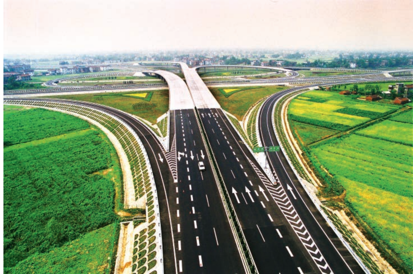
宁通高速公路九华立交

1998年，为了做好新一轮机构改革的准备工作，按照省编委和市委、市政府部署，组织市直有关部门和各县（市）编办围绕事业单位实行政事分开、理顺条块关系，实行投资主体多元化、改革财政拨款体制、调整布局结构以及完善内部管理体制等展开广泛的调查研究。市建委作为省确定的事业单位机构改革试点单位，在市编办协助下，拟定改革方案，内容涉及调整职责、机构、人员编制、管理体制等方面，为全省事业单位机构改革提供了经验。市科委根据国务院《关于“九五”期间深化科技体制改革的决定》精神，会同市编办研究制定《南通市市属科研机构体制改革指导意见》，对不同类型科研机构提出分类实施的具体意见。工资、保险等部门就特困事业单位改革中有关问题的处理形成操作意见，保证改革顺利进行。市编办、人事、财政等部门联合对海安县下发《关于推进事业单位改革试点工作的意见》，组成工作组，具体负责试点单位改革的指导工作，并召开试点单位情况交流会，总结推广试点单位的经验。在全县事业单位全面推广试点单位用人招考制度，实行“凡进必考”，提高事业单位人员素质。