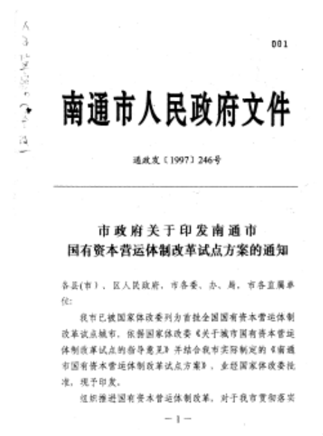
《市政府关于印发南通市国有资本营运体制改革试点方案的通知》

1997年7月，《南通市国有资本营运体制改革试点方案》获国家体改委正式批准，南通成为全国首批国有资本营运体制改革试点城市。在摸清家底的基础上，南通注重培育和壮大重点企业集团，全市形成15家重点企业集团，全年新组建企业集团31家，其中省级19家、市级12家。先期组建的国有资本营运机构运作，形成权责明确的资本营运实体。