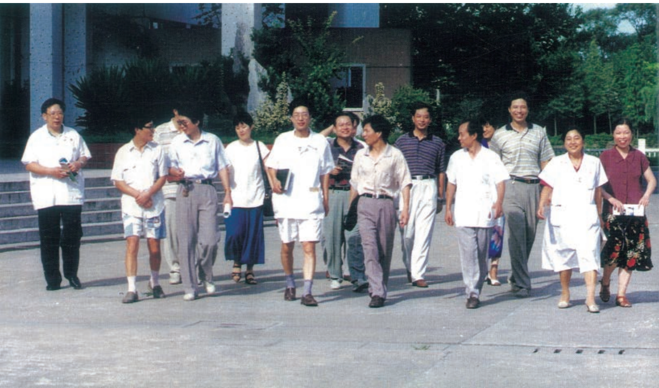
南通医学院知识分子群体

媒及《新华日报》、《扬子晚报》、江苏人民广播电台、江苏电视台、《中国交通报》、《中国青年报》、中央人民广播电台、《光明日报》、新华社、《人民日报》先后报道通医优秀青年知识分子群体先进事迹。9月，省委宣传部、省委教育工委联合在南京召开学习宣传南通医学院优秀青年知识分子群体先进事迹报告会，省委教育工委、省教委联合发出《关于在全省教育系统开展学习南通医学院优秀青年知识分子群体活动的意见》，南京各大新闻单位再次推出通医优秀青年知识分子群体的长篇报道，把优秀青年知识分子群体宣传活动推向深入。这批年轻的知识分子被誉为跨世纪的专家群，至今仍然是教学、科研、医疗等领域的骨干。