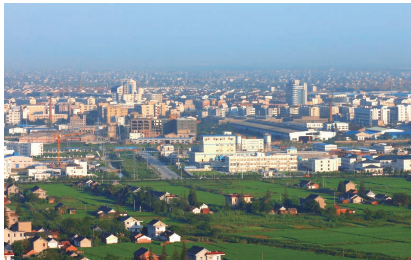
20世纪90年代的南通市经济技术开发区

随着治理整顿任务的完成和国际国内形势的好转，市委、市政府于1990年提出的“外向开拓”发展战略在这一年取得明显成效。1992年，市委、市政府出台《关于加快市经济技术开发区建设若干问题的决定》，市政府相继出台《关于加大改革开放力度，