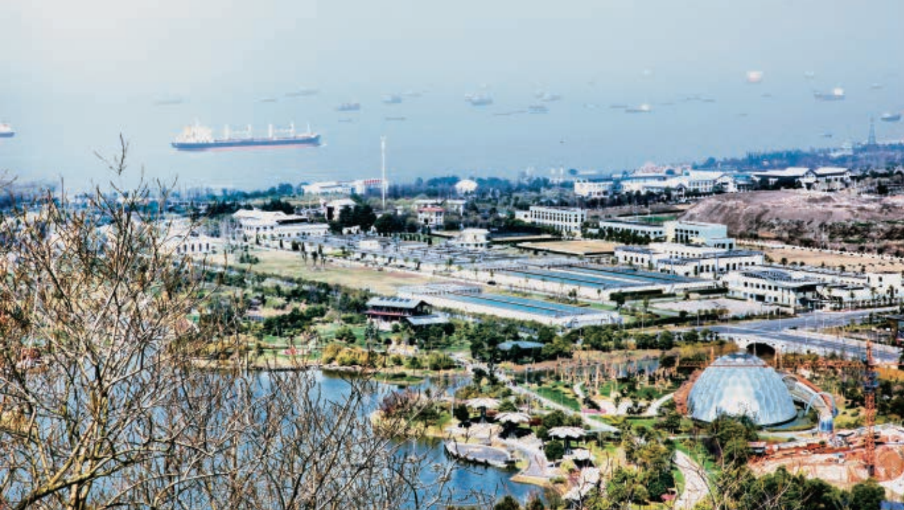
狼山水厂鸟瞰