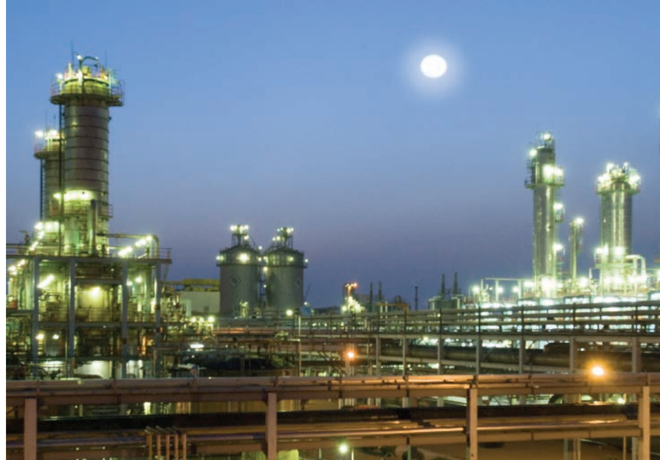
南通醋酸纤维有限公司

1994年5月20日，南通机床股份有限公司（集团）股票在上海证券交易所上市，成为南通市获准向社会公开发行股票的首家企业，股票代码600862。公司于1988年12月26日成立，为南通市第一个股份制企业集团。1993年3月16日，经国家经济体制改革委员会批准，南通机床集团公司成为南通市向社会公开发行股票的规范化股份制试点单位。此后，陆续有多家企业上市发行股份，企业融资的途径进一步拓宽。