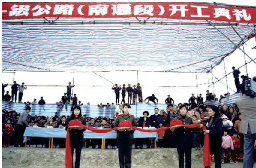
1994年4月18日，宁通一级公路南通段开工典礼现场。

宁通一级公路起点南京，终点南通，全长243公里。南通段西起泰州靖江市与如皋市交界处的七圩村，东至九圩港大桥西端，全长37.738公里，双向四车道，路基宽24.5米，设计车速每小时100公里，总投资51897万元。1994年4月18日，宁通一级公路南通段在如皋张黄地段施工现场举行开通典礼。当日，宁通一级公路南通段焦港大桥第一根灌注桩成功浇筑完毕，为宁通一级公路南通段打响第一炮。1995年9月25日，市政府召开宁通一级公路南通段工程建设新闻发布会，通报工程建设情况。1996年11月19日，宁通一级公路建成，11月28日全线通车。