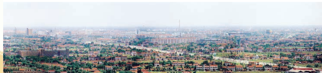
20世纪90年代的南通城区

1991年5月6日，经国务院批准，南通市城区更名为崇川区，郊区更名为港闸区。崇川区辖3个乡1个镇7个街道，即八厂乡、钟秀乡、任港乡，狼山镇，城东街道、城中街道、城西街道、新城桥街道、虹桥街道、人民西路街道、西公园街道。港闸区辖7个乡2个镇，即陈桥乡、幸福乡、秦灶乡、永兴乡、芦泾乡、闸东乡、闸西乡，天生港镇、唐闸镇。之后，南通市政府又根据发展需要，对部分村镇区划作了适时调整。