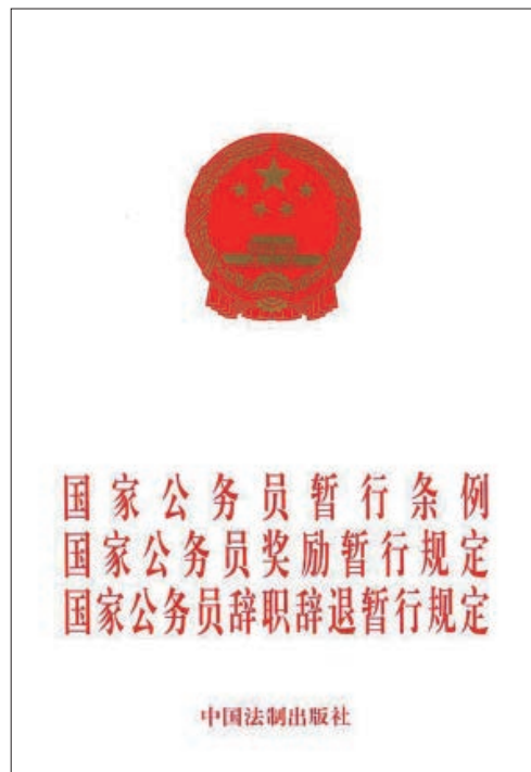
《国家公务员暂行条例》

1993 年颁布实施的《国家公务员暂行条例》，对机关工作人员管理做了规范。按照规定，1997 年，南通市、县（市、区）、乡镇三级机关在岗、在职、在编的 2.2 万多名工作人员经过考试，完成向国家公务员过渡。