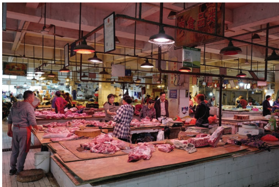
南通市区某农贸市场

猪肉供应在居民副食品中占有重要地位，20世纪50年代以来一直实行统购统销。1985年，取消统购统销政策。从1991年3月起，取消猪肉凭票定量供应办法，肉食品全部敞开供应。此后，肉食品市场开始多渠道竞争经营，个体经营户迅速挤占市场，生猪经营主渠道逐步易位，公有资本逐步退出经营。