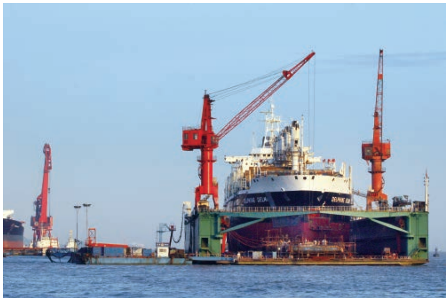
中远浮船坞

1991年9月16日，中国自行设计制造的15万吨级浮船坞“南通号”，经过近16小时航行，从上海安全驶抵南通船厂码头。船坞长254米，外宽58米。南通远洋船务公司年内开始使用“南通号”浮船坞作业，国内不能修理7万~15万吨远洋巨轮的历史由此结束，南通远洋船务公司在全国同类企业中名列前茅，修船量占全国远洋船舶总承修量的比例不断上升，成为江苏省创汇大户。1999年底，《亚洲劳氏海运》刊载亚洲最佳修船企业评比，南通远洋船务公司获列亚洲第二名。