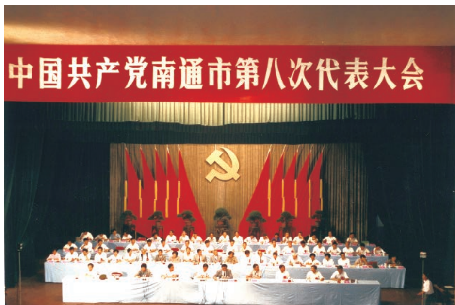
1994年9月，中共南通市第八次代表大会会议现场（主席团成员）。

1994年9月20—23日，召开中国共产党南通市第八次代表大会，确立到20世纪末的两大目标，即改革走在全省前列，率先建立起适应社会主义市场经济体制框架的运行机制；经济发展速度和效益位居全省前列，全市人民生活提前进入小康，有条件的地区基本实现现代化。会议将发展外向型经济、建立现代企业制度、发展农村经济、调整经济结构、加强民主法制建设、精神文明建设等作为改革和建设的重点，并对党的建设提出了具体要求。