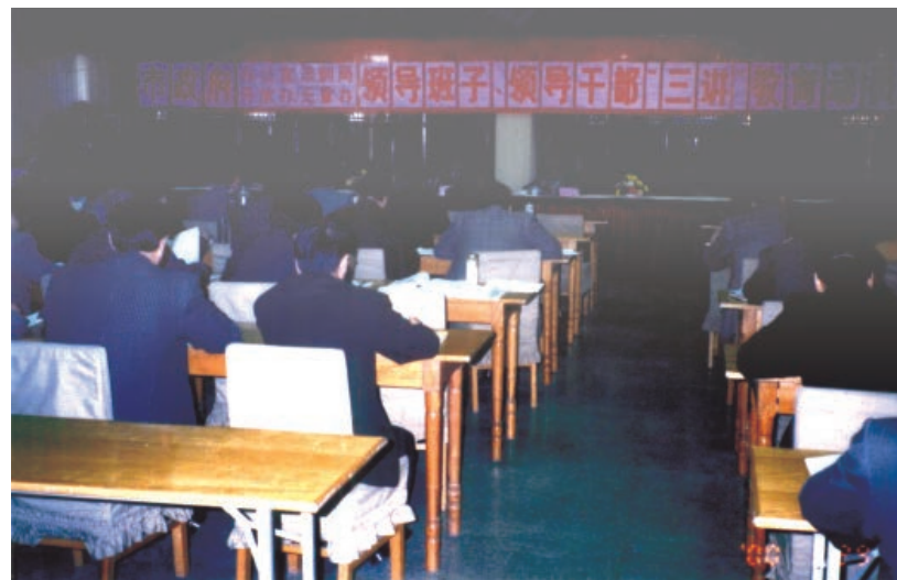
2000年3月29日，市政府“三讲”动员大会会场。

1999年，根据《中共中央关于在县处级以上党政领导班子、领导干部中深入开展以“讲学习、讲政治、讲正气”为主要内容的党性党风教育的意见》要求和省委统一部署，全市领导干部开展“三讲”教育活动。4月以后成立市委“三讲”教育领导小组