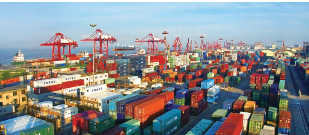
繁忙的集装箱码头

万标准箱，全年国际集装箱完成15.8万标准箱，比1998年增长21.6%，吞吐量在全国内港排名第一。南通港集装箱码头有限公司正式开通长江至国内南北沿海集装箱水路运输直达航线，填补了国内江海内贸集装箱联运中转的空白。