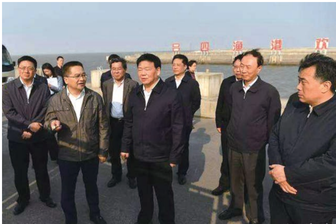
省委书记娄勤俭到南通调研，参观吕四渔港。

为贯彻落实好省委对南通提出的追赶超越、争当先锋的要求，南通市委结合解放思想大讨论，起草了关于解放思想、追赶超越、争当先锋，推动高质量发展的若干意见，明确了之后一个时期的主要目标和重点任务，力求通过开创性举措，发挥撬动性效应，谋求格局性变化，确保省委要求在南通落地见效。