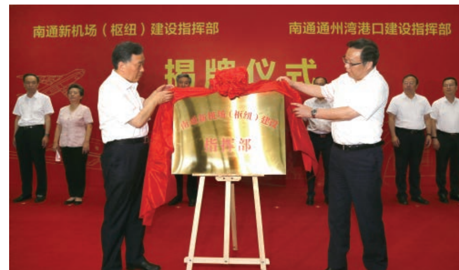
南通新机场建设指挥部揭牌

2019年南通新机场规划建设被列入《长江三角洲区域一体化发展规划纲要》，将成为上海国际航空枢纽重要组成部分，和上海虹桥机场、浦东机场共同组成上海航空主枢纽。南通新机场将通过即将开工建设的北沿江高铁，与上海虹桥、浦东机场快速联通，建成“轨道上的机场”。新的机场将极大地提升南通城市品质，为新的发展插上腾飞的翅膀。