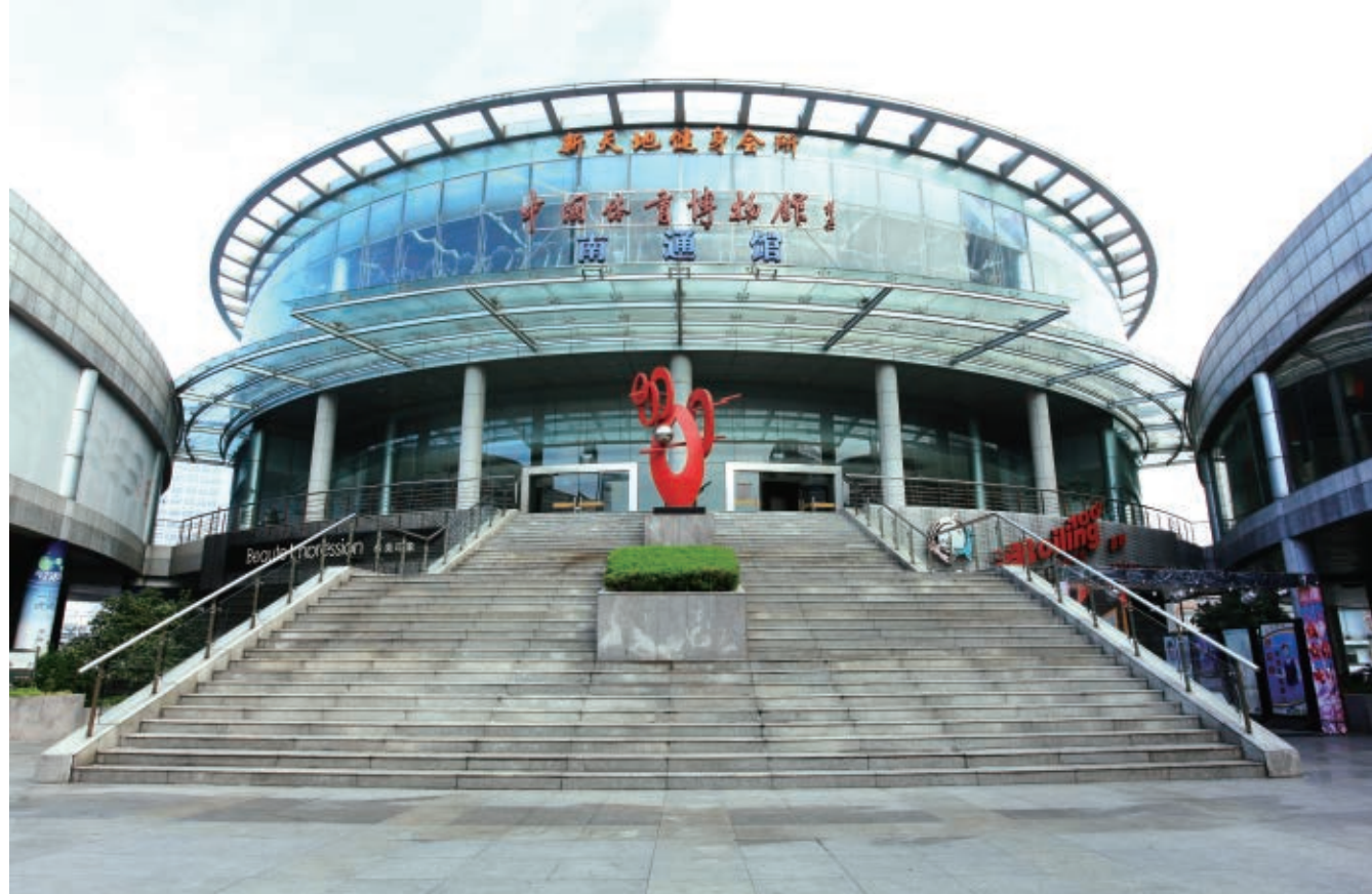
中国体育博物馆南通分馆

交通是城市发展的基础，铁路是经济发展的大动脉。随着宁启铁路动车开通，南通市民的出行变得更加便利，南通的综合交通优势得到进一步凸显，这对于密切南通市与长三角各城市之间的联系和对外交往，以及促进区域经济社会发展都具有重要意义。