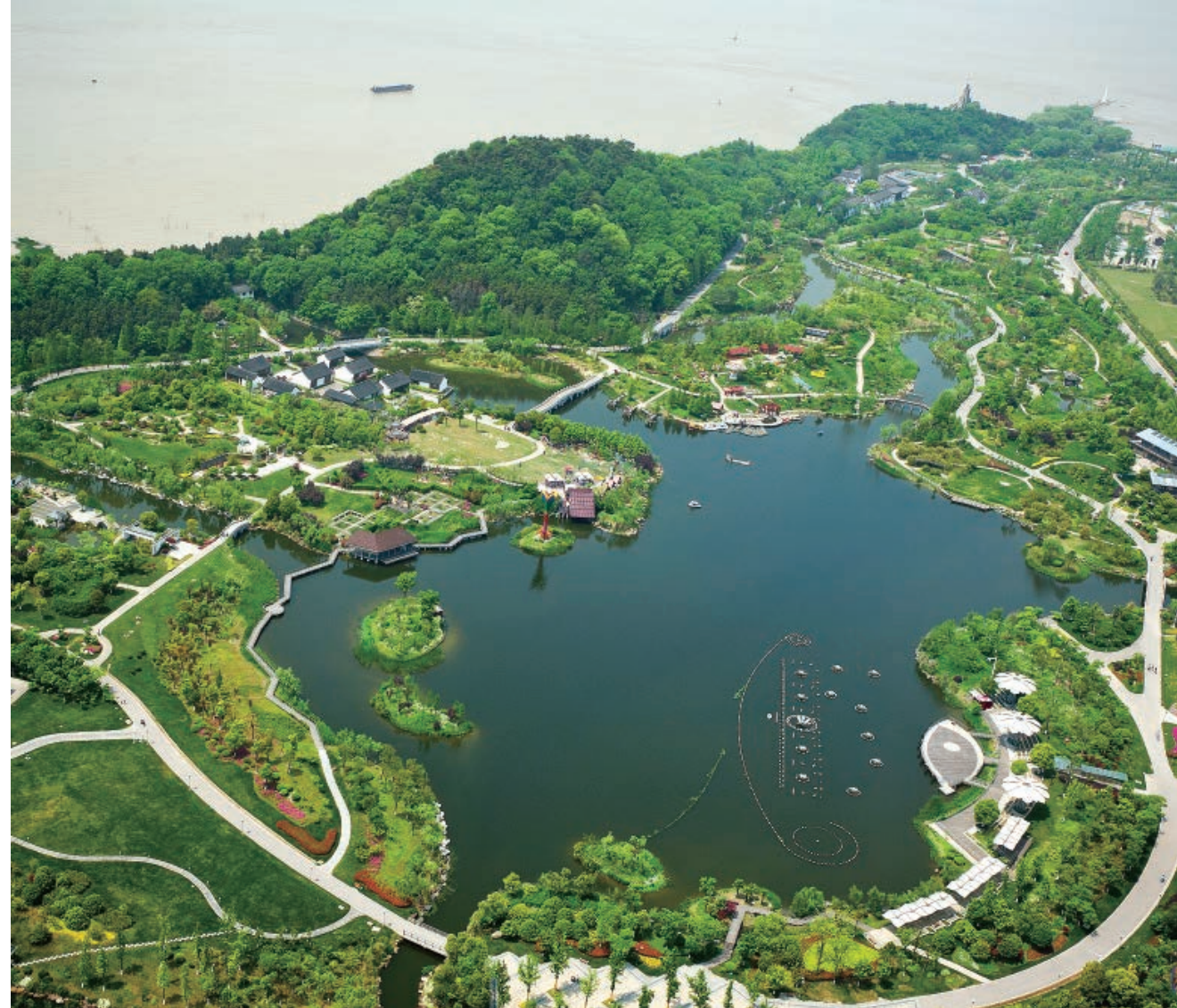
五山森林公园

南通用实际行动诠释了“让森林走进城市、让城市拥抱森林”的创建宗旨要义，也为全国很多地区开展森林城市建设提供了“南通方案”。