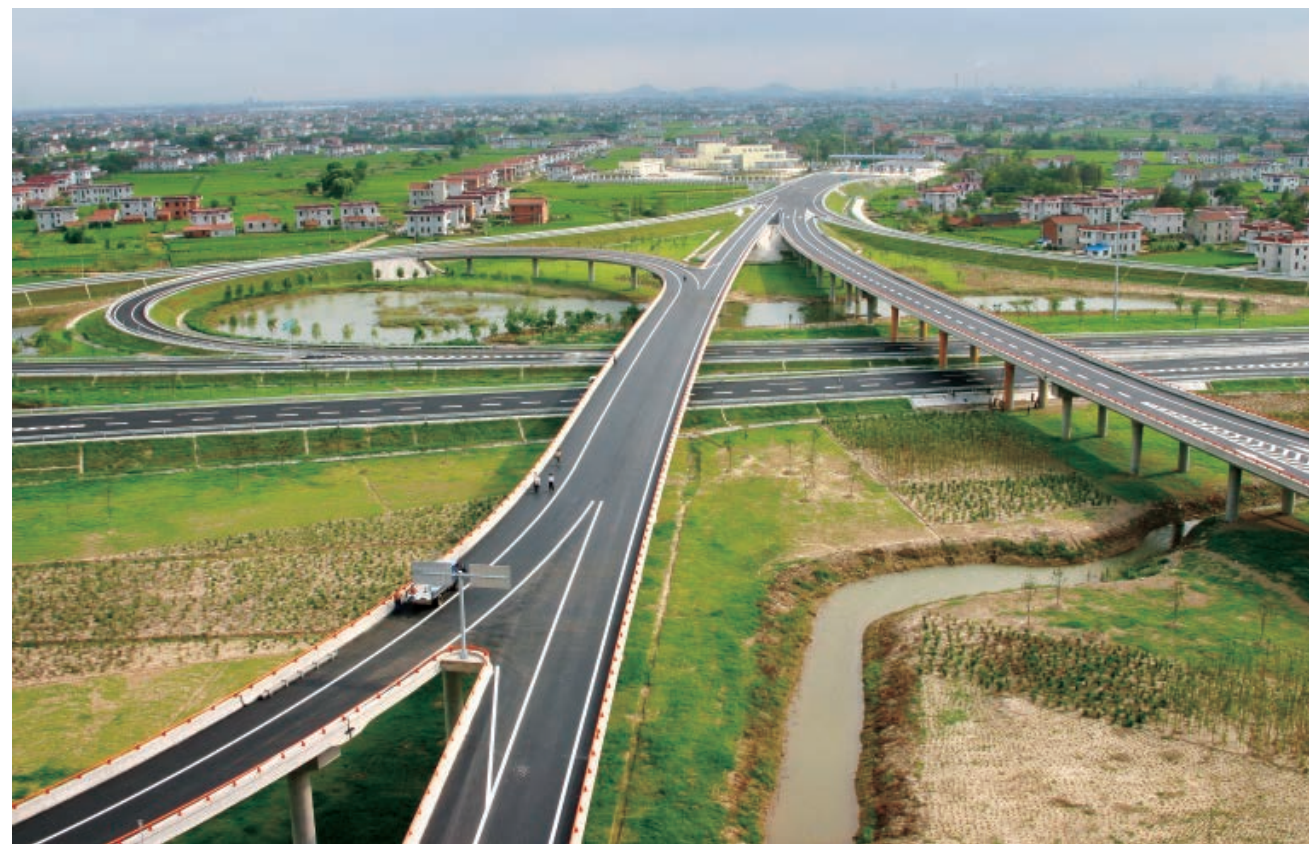
建设中的南通北立交

早在2009年，南通市委、市政府即提出“102030”交通畅通工程目标（主城区机动车辆10分钟上快速路、20分钟上高速、30分钟主城区范围通勤）。2014年5月30日，备受市民关注的通京大桥（三号桥）、通盛大桥（五号桥）互通立交正式开放交