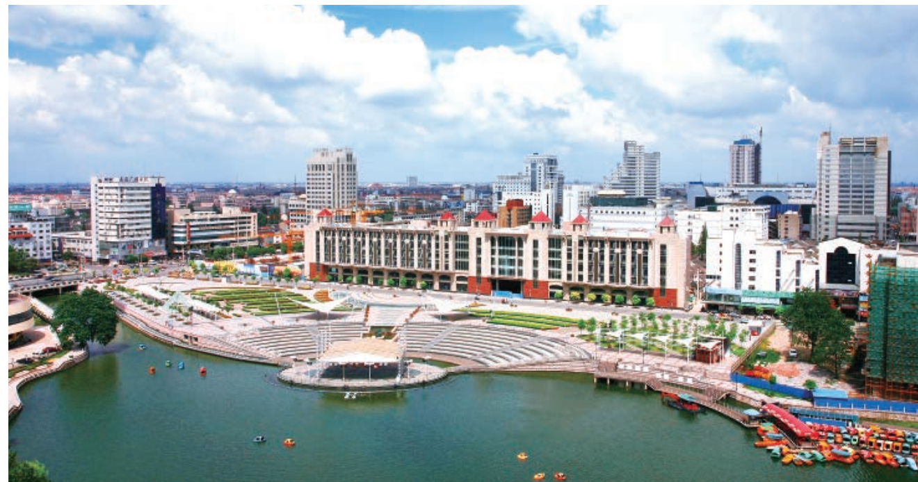
环西文化广场

南通市推进以改善民生为重点的“十大体系”建设，办好各项富民、惠民工程，切实改善民生、服务百姓、增进和谐。1月，市委、市政府下发《关于进一步加强社会建设 加快构建民生幸福城市的意见》，全年围绕增加居民收入、全面提高城乡社会保障水平、有效保障困难群众基本生活、扎实推进安居工程建设、持续发展社会事业开展工作，民众幸福感不断提升。