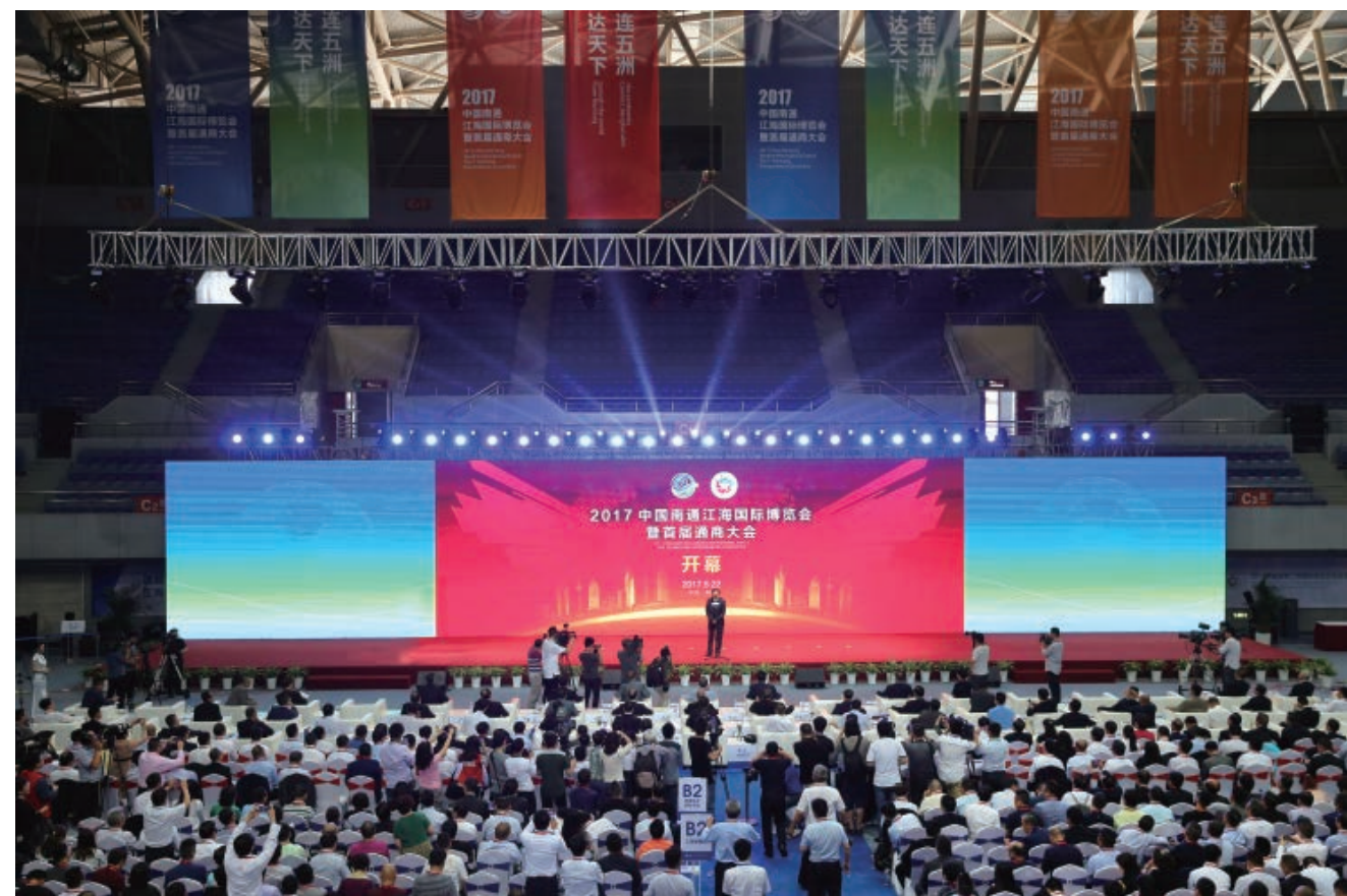
2017 中国南通江海国际博览会暨首届通商大会

2017 年 5 月 12 日，南通确定“强毅力行、通达天下”的通商精神。5 月 22—24 日，2017 中国南通江海国际博览会暨首届通商大会在南通市体育会展中心召开。此次大会以“通商达天下、