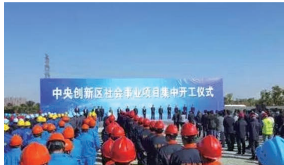
2017 年 4 月 1 日，南通中央创新区首批 4 个基础设施建设项目集中开工。

中央创新区建设是南通市委、市政府策应江苏“一中心、一基地”（具有全球影响力的产业科技创新中心和具有国际竞争力的先进制造业基地）建设、“1+3”功能区战略和对接服务上海做出的重要决策部署。中央创新区位于新城区东部、地处崇川区和南通市经济技术开发区交界处，规划范围约 17 平方公里。区