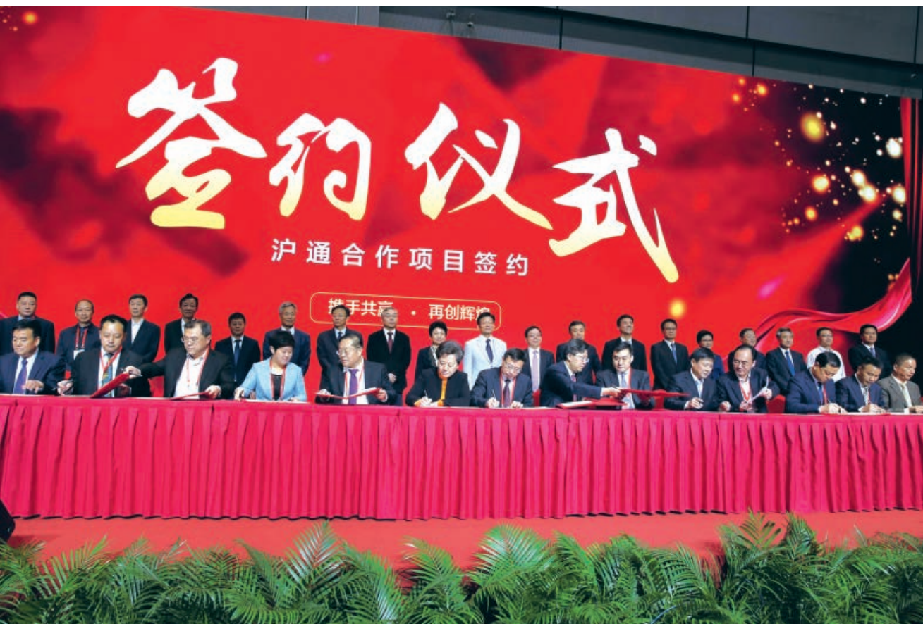
2017年4月27日，服务大上海，建设“北大门”，南通对接服务上海大会在上海举行。图为沪通合作项目签约现场。

2016年11月19日，时任江苏省委书记李强在参加省第十三次党代会南通团审议时指出，南通接轨上海优势独特、前景广阔，交通优势正在强化，空间优势很大。随着“一带一路”、长江经济带、