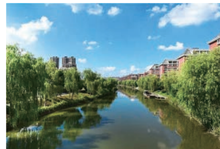
南通全面推行河长制