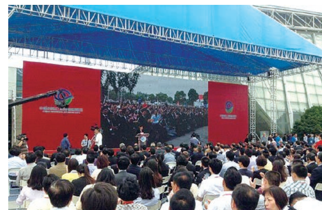
首届江海国际博览会

靠江靠海的南通，不断挖掘江海发展资源，推进陆海统筹发展，2013年5月28日至6月2日，以“聚焦创新发展、展示江海风采”为主题，在市体育会展中心举行首届江海国际博览会。此次博览会涵盖经贸、农业、文化、旅游、教育、人才、体育等多个领域，并专门创作主题歌《蓝印花》，以歌曲形式凝练南通地方特色和文化内涵，扩大影响力。并先后举办战略性新兴产业发展成果展、国际海洋工程及装备展览、南通旅游商品精品展、江苏省非物质文化遗产技艺大展等大型展会。国家、江苏省、上海市有关部委办厅局相关领导，相关国家使节，18个国家和地区1100多名嘉宾会聚南通，共襄盛会。此次博览会推进和扩大了南通与海内外的经济文化交流与合作，有效提升了城市核心竞争力和对外开放水平。