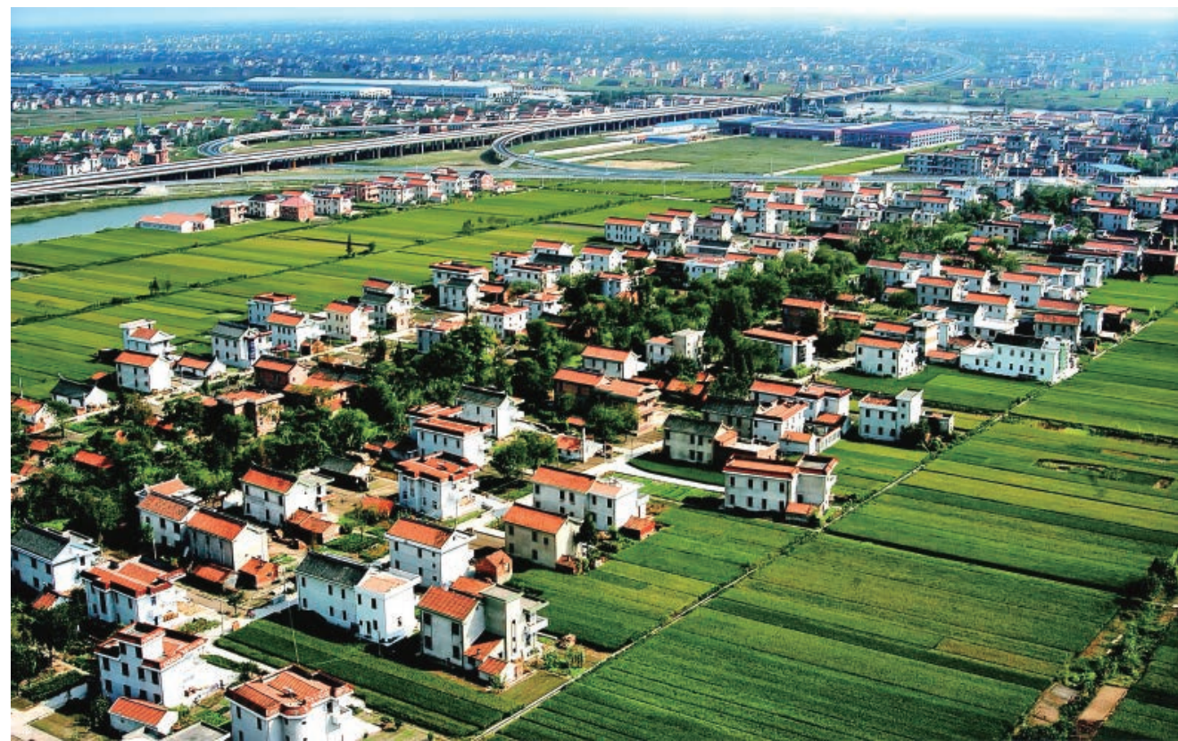
江海平原新农家

为攻克制浆造纸尾水零排放这一世界级难题，南通市经济技术开发区邀请中国工程院院士徐南平及南京工业大学专家团队领衔设计，20多名国内相关领域专家作为技术支撑团队，于2014年初建成全球规模最大的首套制浆造纸尾水零排放成套工艺装