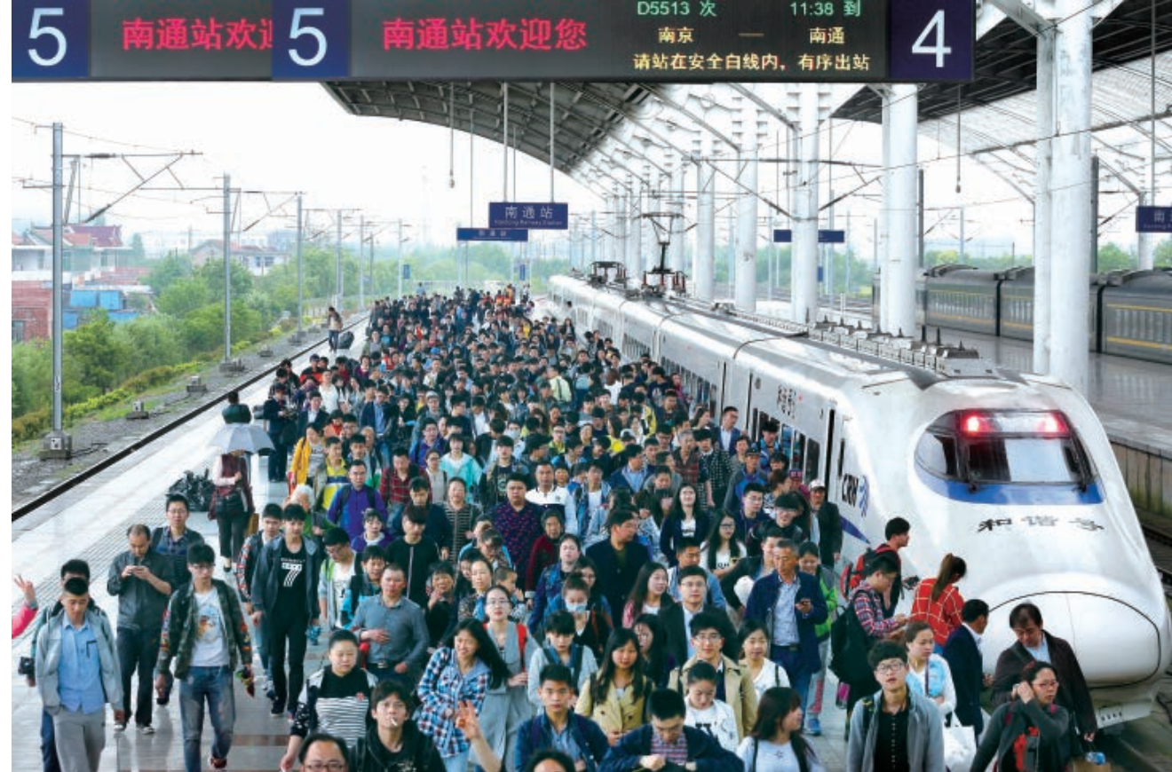
宁启铁路动车开通

12月28日,市委出台进一步贯彻党的十八届六中全会精神推进从严治党的决定等“1+3”文件[《关于运用监督执纪“四种形态”的意见》《关于建立容错纠错机制的办法(试行)》《关于治理“为官不为”行为的办法(试行)》《关于对党员和公职人员侮辱诽谤诬陷他人行为的查核处理办法(试行)》],既筑牢纪律防线,又激励担当作为,为南通进一步营造风清气正的政治生态和干事创业的发展环境奠定基础。