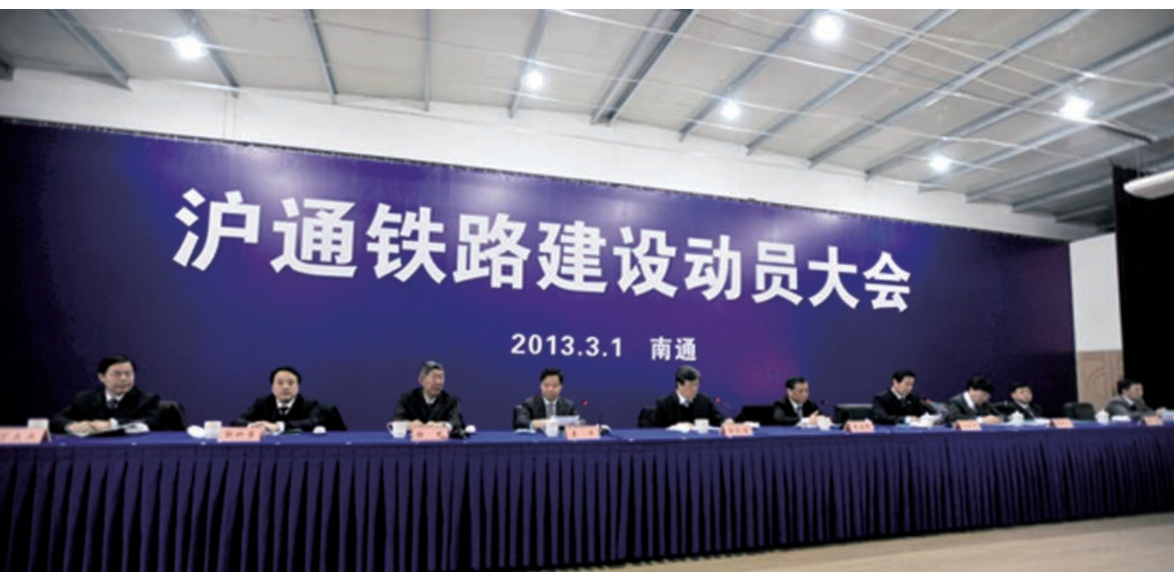
沪通铁路建设动员大会

路六车道设计。沪通铁路是国家实施江苏沿海开发战略重要的骨干性工程，是继苏通大桥后又一条具有世界领先水平的连接南通与上海、苏南的过江通道；南通将成为长江流域继武汉、南京后又一座同时拥有三条以上过江主通道，又兼有公、铁复合功能的城市。沪通铁路建成后，沿海铁路大通道将全面贯通。南通向南可往浙江、福建、广东等地区编组发车，城际高速铁路的开通将使南通到上海、嘉兴等地的列车车程缩短至40分钟左右，南通经锡通通道到苏州市区、无锡市区的汽车车程也将缩短至40分钟左右。项目为南通建设以上海为龙头的长三角北翼经济中心提供实质性、强有力支撑，对南通市江海联动开发、形成区域性物流中心和加快中心城市建设具有重要意义。