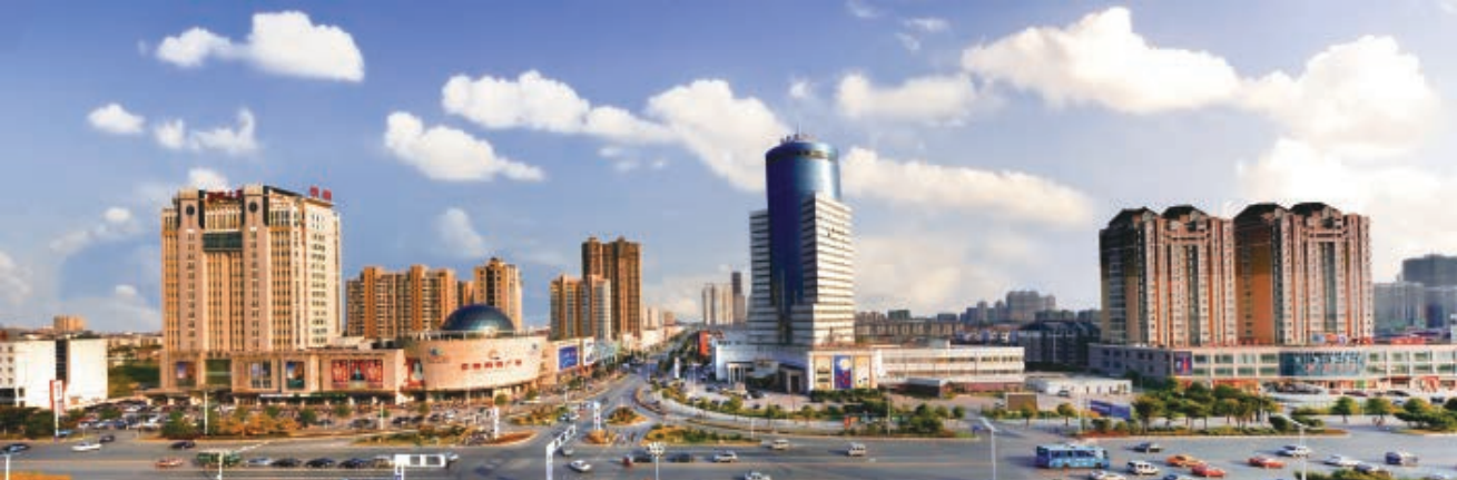
海安城市风光