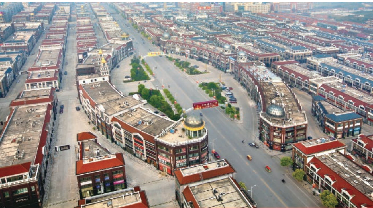
国际家纺城全景

“十三五”期间，南通市将围绕建设长三角先进制造业基地和现代服务业基地，实施一批重大产业项目。在扩大投资总量的同时，优化投资结构。“十三五”期间，全市计划完成固定资产投资近3万亿元，其中产业投资占比超过65%，投资年均增幅在12%以上，高新技术产业投资占工业投资比重超过40%。