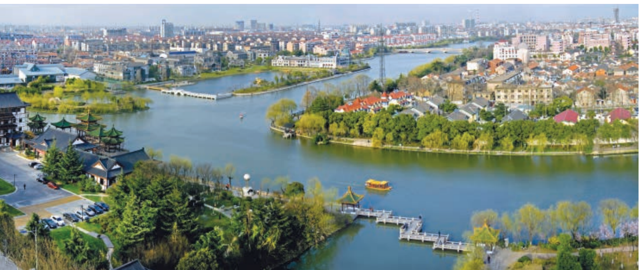
濠河风景名胜区

2016年7月11日，南通市首部实体性地方法规《南通市濠河风景名胜区条例》经南通市第十四届人民代表大会常务委员会第三十五次会议审议通过。7月29日，经江苏省第十二届人民代表大会常务委员会第二十四次会议批准，于2016年12月1日起施行。