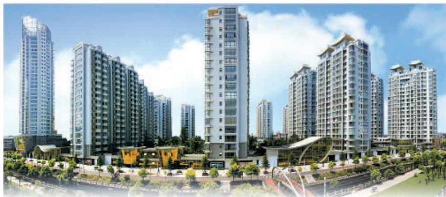
海安经济技术开发区

2013年，如皋经济技术开发区、海门经济技术开发区、南通高新技术产业开发区和南通保税区相继成为国家级开发园区，开发开放园区在南通经济社会发展中日益发挥重要作用。