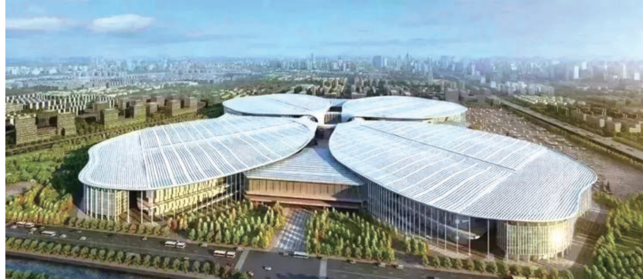
2018 年 11 月，中国国际进口博览会在上海举行。

南通五山森林公园位于南通市区南部沿江地区，由临江而立的狼山、军山、剑山、黄泥山、马鞍山及园博园、啬园等周边区域组成，占地面积 1080 公顷，是南通市主城区重要的城市生态功能板块。2017 年以来，市委、市政府贯彻落实习近平总书记关于“把长江生态环境摆在压倒性位置，共抓大保护，不搞大开发”的重要指示精神，将五山地区长江岸线由生产型岸线调整为生态型、生活型岸线，调整优化沿江生产力布局，全面实施五山及沿江地区生态修复和保护工作，在优化提升原省级狼山森林公园的基础上，新建军山森林片区、植物园片区、滨江生态片区、啬园玉兰谷片区、生态配套片区等森林片区，新增森林面积 392 公顷，仅用了一年多的时间，就成功创建国家级森林公园，成为“面向长江、鸟语花香”的“城市会客厅”。