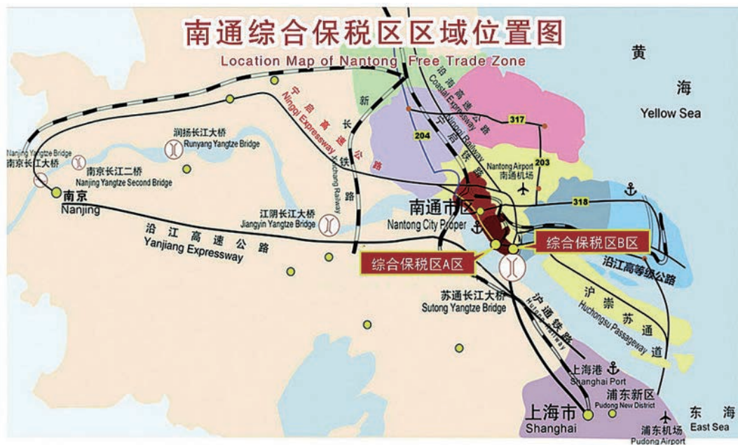
南通综合保税区区域位置图

能，享受税收、海关、国检、外汇、外经贸5个方面的政策。南通综合保税区共两个区块：A区位于原出口加工区范围内，规划面积1.5平方公里；B区位于苏通大桥东侧，规划面积3.79平方公里。经过近一年的推进，当年12月，经国家10部委联合验收，南通综合保税区（一期）正式运行。