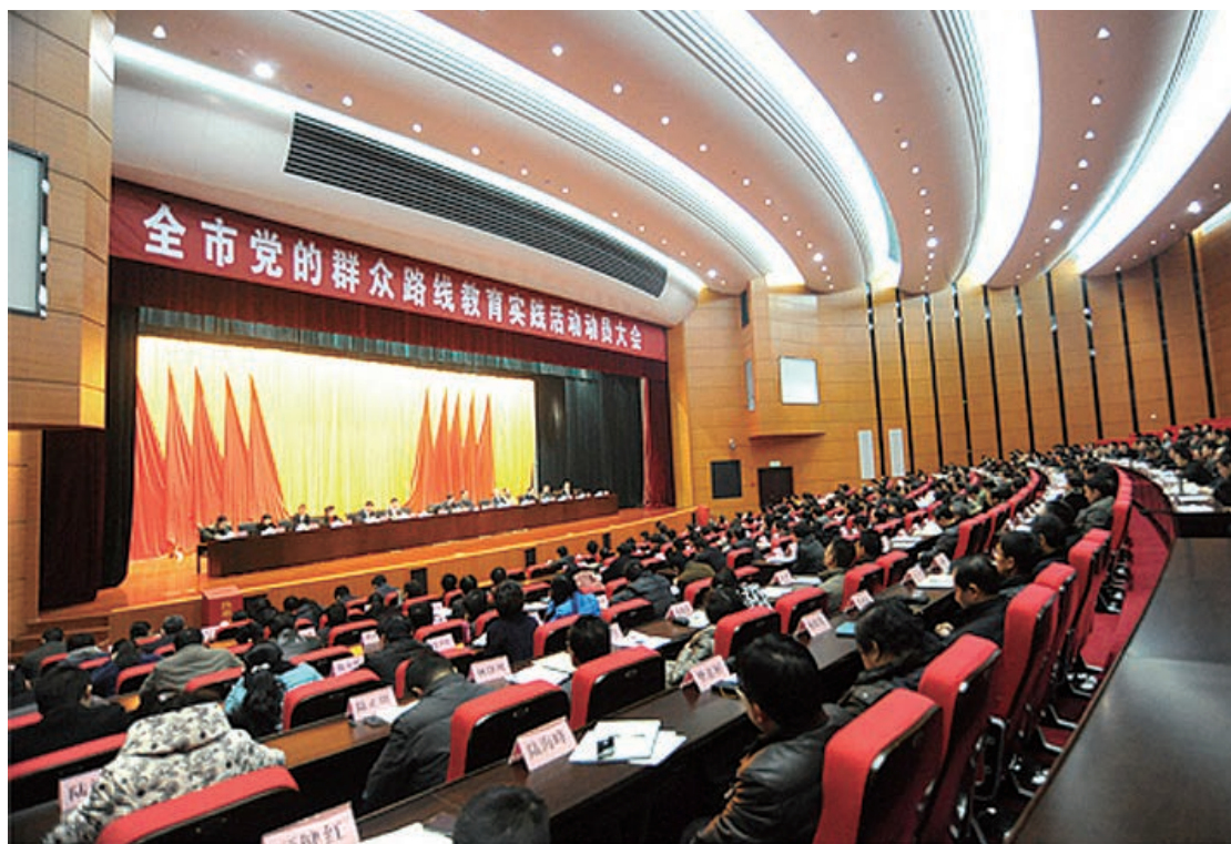
全市党的群众路线教育实践活动动员大会召开

“十大专项治理行动”的实施方案》，以开展“十大专项治理行动”为抓手，重点围绕社会关注度高、群众反映强烈的十个方面突出问题出重拳、下猛药，开展专项治理工作。活动动真格、求实效、办实事，整治“四风”问题拿出了一张实实在在的成绩单，“三解三促”、领导干部接访包案、专项整治等活动深入开展，作风建设持续推进，形成作风建设新常态，成果显著，受到群众广泛好评，并得到中央巡回督导组和省委领导的充分肯定。