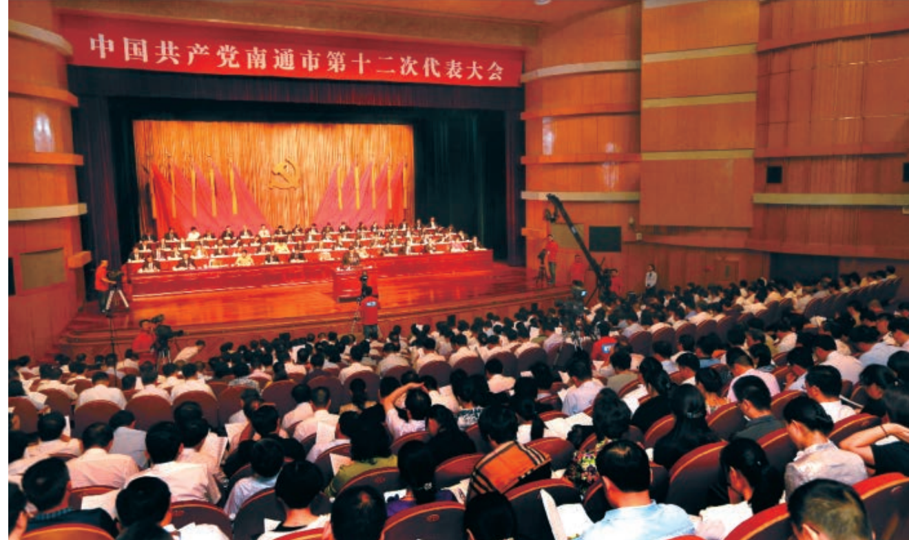
2016年9月26日，南通市第十二次党代会在更俗剧院隆重开幕。

“十三五”期间，南通市统筹推进经济建设、政治建设、文化建设、社会建设、生态文明建设和党的建设，着力建设经济强、百姓富、环境美、社会文明程度高的新南通，率先全面建成小康社会，积极探索开启基本实现现代化建设新征程，谱写好中华民族伟大复兴中国梦的南通篇章。这在南通发展史上具有里程碑意义。