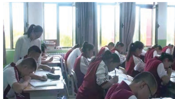
南通教师到新疆伊宁支教

2000年，南通市与陕西省咸阳市结为对口支援城市，并签订教育对口支援协议。12年间，南通市及所属各县（市、区）在咸阳实施扶贫协作建设项目69个，援助资金2040万元，建起咸阳实验中学综合教学楼、咸阳市特殊教育学校综合楼等。先后有200多名特级教师、学科带头人、骨干教师赴咸阳进行支教讲学活动，为咸阳培训高中教师6200余人，培训义务教育阶段教师1.3万人次，培训初中、小学骨干教师1500人次。2012年，南通市完成援助陕西咸阳、新疆伊宁教育对口支教工作。暑期，组织2批支教团队分赴咸阳、伊宁培训，同时接受咸阳、伊宁等地到南通市挂职学习80人。