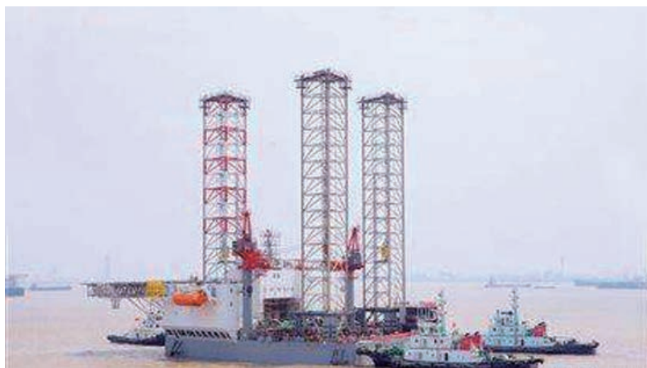
“振海 1 号”下水

2013 年 7 月，上海振华重工南通基地自主研发的“振海 1 号” 300 英尺钻井平台完成下水作业试验。8 月，首批 5000 吨材料设备从招商局集团深圳基地运抵海门，招商局重工（江苏）有限公司投入生产，承接自升式平台、铺管船等各类订单 11 艘，合同金额超 23 亿美元。10 月，中远启东海工基地设计建造的“希望 3 号”超深水钻井平台完工交付。12 月，南通中远船务设计建造的“东安吉 2 号”风电安装船试航。