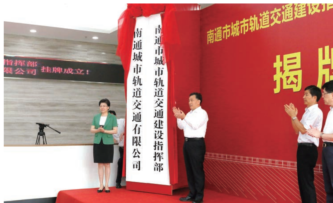
2017 年 8 月 15 日，南通市城市轨道交通建设指挥部和南通城市轨道交通有限公司挂牌成立。

南通城市轨道交通 1 号线一期工程线路总长 39.182 公里，设站 28 座，投资 257.92 亿元，规划建设期为 2017 年至 2022 年。