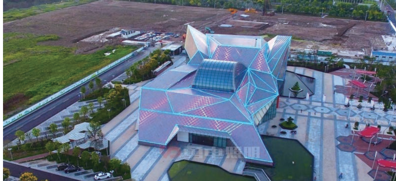
如皋汽车文化馆俯瞰图

2017 年 11 月 12 日，2017 首届海外通商峰会暨“走进非洲”合作恳谈会在南非约翰内斯堡开幕。